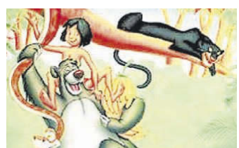
Das Dschungelbuch, trickverfilmt von Disney. FKN/VERLEIH