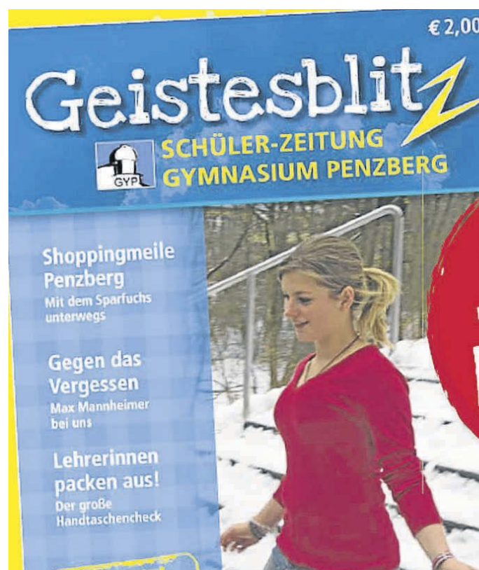
So sieht er aus: der Zeitung gewordene „Geistesblitz“. FKN