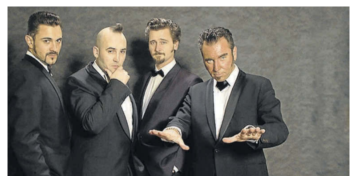
Gratis zu erleben: die Root Bootleg Band. FKN

Schongau – Zum zwölften Mal öffnet der Schongauer Kuriositäten- und Künstlermarkt am kommenden Freitag seine Stände. Am Marienplatz bauen Händler und Wirte ihre Stände auf – was uns aber viel mehr interessiert: Es gibt Gratis-Konzerte, Partys und besondere Filmvorführungen. Aber von vorn: Eröffnung ist am Freitag, 15. Juli, um 12 Uhr – die Öffnungszeit für jeden Tag. Abends um 19 Uhr spielt die Latin-Formation „Mundo Latino Son Cubano“, während um 20 Uhr im Lagerhauskino „Polnische Ostern“ gezeigt wird. Die „Laimer Music Corporation“ bringt am Samstag, 16. Juli, Rhythm'n'Blues, Soul und Pop auf die Bühne am Marienplatz. Konzert-Beginn ist um 19 Uhr, um 20 Uhr