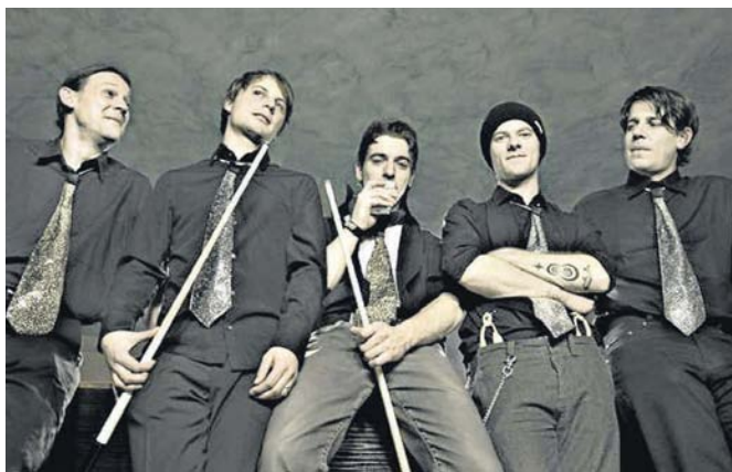
Swingin' Cotelettes in Böbing.

Von Reggae bis Hardcore reicht die musikalische Palette bei den Festivals der Region. In diesem Jahr sind es vor allem Klassiker, die das Geschehen bestimmen – Böbings Open Air am Sportplatz, Raistings Lucky Lake am Baggersee und Murnaus Kulturknall, dieses Mal auf einem Anwesen in Hochried.