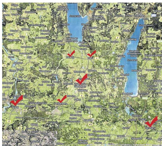
Lebenswerter Landkreis? Wir haben bereits in sechs Gemeinden nach den Wünschen der Jugendlichen gefragt: Jetzt seid ihr dran. Meldet Euch – wir hören zu, garantiert! GOOGLE.MAPS/UCU

von A nach B zu gelangen oder auf die öffentlichen Verkehrsmittel angewiesen ist, um weggehen, einkaufen oder in den nächsten (Live-)Club zu gelangen. Da kann man schon mal an seine Grenzen stoßen... Umso wichtiger, dass Eure Wünsche gelesen werden. Denn welcher Bürgermeister möchte eine Gemeinde ohne Jugend am Ort...? Meldet Euch, Eure Jugendgruppe oder Eure Clique an unter jugendseite.wm-tagblatt@merkur-online.de .