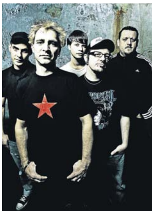
Betontod in Böbing.