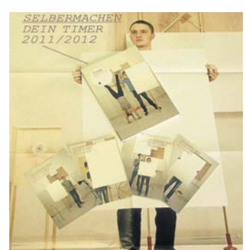
So sieht er aus, der Timer. CU

Was? Die Ferien haben noch nicht mal angefangen und die Jugendseite kommt schon mit dem Schuljahr 2011/2012 daher? In diesem Fall sei uns diese Ungemütlichkeit gestattet – aus ganz pragmatischen Gründen. Wer nämlich jetzt schon den „Timer“ der „Bundeszentrale für politische Bildung“ (bpb) bestellen möchte, kann zum Beispiel durch eine Sammelbestellung einen Haufen Geld sparen. Der als Hausaufgabenheft verwendete Taschenkalender steht unter dem Titel „Selbermachen!“ und bietet gewitzten Raum für Kreativität – wemöglich, wenn eine Chemieder Lateinstunde ausnahmsweise mal nicht ganz so interessant ist – kostet dann 3 €, vier bis 49 Exemplare 1,50 € oder über 100 Stück 75 Cent. Also, Klassenkameraden und -kameradinnen fragen – und sparen! Info: www.bpb.de/timer