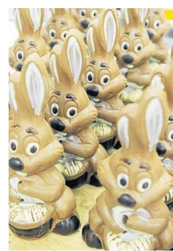
Hasen feste feiern. ULI DECKDORF

Bernried Nach der Hasenjagd ist vor der Hasenjagd: Im Saustall