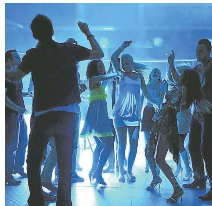
Auch Minderjährige wollen feiern, selten aber gemeinsam. Die 16- bis 18-Jährigen beziehungsweise die 14- bis 15-Jährigen ziehen es vor, getrennt Party zu machen. FKN

Die Ü-14- und Ü-16-Partys sollen nach Regauers Wunsch übrigens demnächst im ganzen Landkreis stattfinden – nach geeigneten Veranstaltungsorten sucht man bereits. Ein erster Schritt aus Weilheim heraus hat jedoch bereits stattgefunden: Ende März lud das Gesundheitsamt Jugendliche zwischen 14 und 16 Jahren zu alkoholfreien Getränken ins Peißenberger Bistro „Step In“ ein. Auch für Weilheim ist die Suche nach einem neuen Platz am Laufen, da die Räumlichkeiten im „Pit Two“ nicht mehr ausreichen. JOR