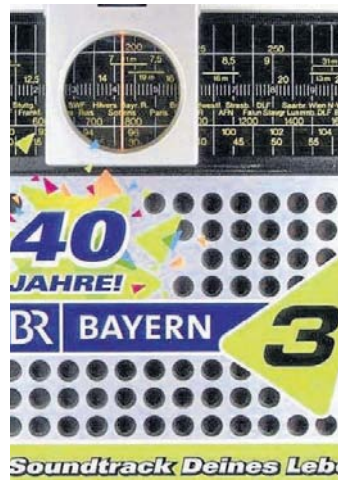
Altes Radio, langes Leben.

„40 Jahre Bayern 3 – Der Soundtrack Deines Lebens!“ Wer öfter Bayern 3 hört, den mag der zurzeit arg strapazierte Slogan vom „Soundtrack Deines Lebens“ schon nerven. Aber kein Zweifel: Er hat seine Richtigkeit – die 1971 gegründete Popwelle hat in diesen 40 Jahren viele junge Bayern geprägt und begleitet. Das beweist auch die Doppel-CD zum Geburtstag mit je einem Hit aus jedem Jahr, von Rod Stewart bis Unheilig. Vor allem die limitierte Jubiläumsbox (anders als die Standard-CD nur im „BR-Shop“ erhältlich) beweist es. Denn die enthält eine Bonus-CD mit ca. 75 Minuten „Radio-Highlights“ – dazu zählen einige der legendären Übergaben zwischen Thomas Gottschalk und Günther Jauch ebenso wie ein Beispiel des wunderbaren Humors von Erwin Pelzig und die verschiedenen Stimmen der „Schlager der Woche“, die einst