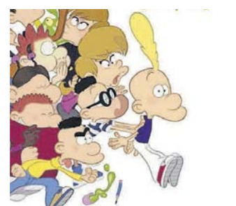
Neville, Maybepop, Titeuf. FKN