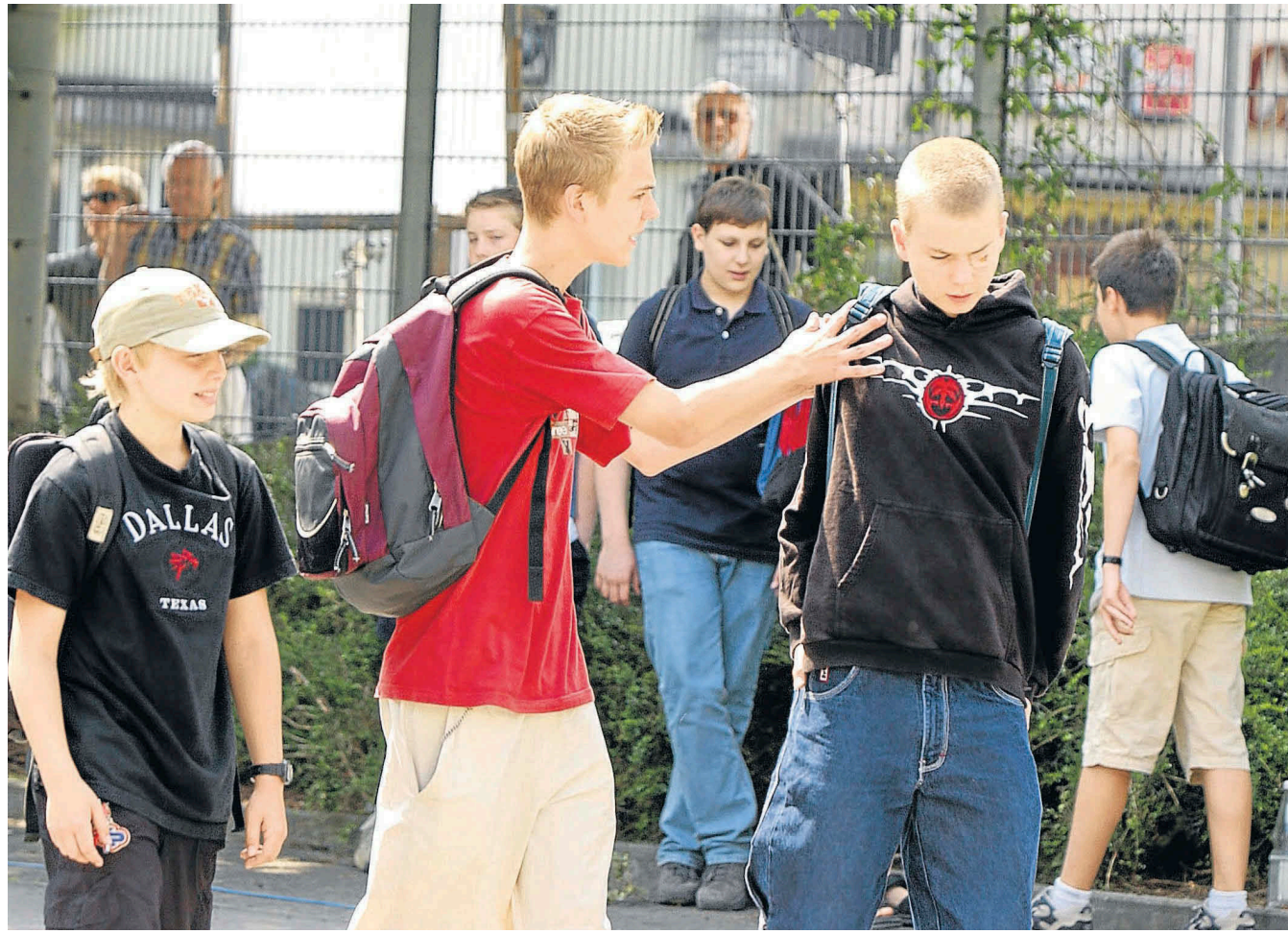
Einer langt zu, alle schauen weg: Mobbing, wie in diesem gestellten Agenturbild zu sehen, ist Thema an Schulen.

■ Wann hat das Mobbing denn angefangen? Schon in der Grundschule. Damals hatte ich zwar noch eine Freundin, die mich verteidigt hat. Als wir nach der vierten Klasse auf verschiedene Schulen kamen, wurde es schlimm. Ich wurde als „Scheiß Rumänin“ beschimpft, da meine gesamte Familie aus Rumänien kommt, und sogar geschlagen. Ich habe manchmal an Selbstmord gedacht.