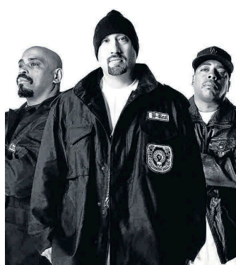
Abendliches Sonnenrot: Mit dabei sind heuer Cypress Hill (links) und The Ting Tings.