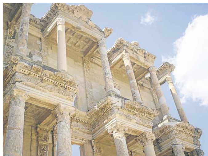
Inspirierendes Ephesus: Blick auf die (rekonstruierte) Celsus-Bibliothek in der ionischen Stadt.

Gebannt blicke ich auf die Überreste von Ephesus, etwa 70 Kilometer südlich von Izmir an der türkischen Westküste, einer der bedeutendsten, ältesten und größten Städte der Antike. Die Stätte atmet Vergangenheit, über-