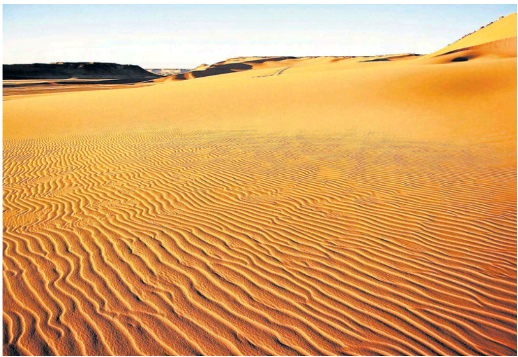
Die 40 Tage Jesu in der Wüste sind Vorbild für die Fastenzeit.