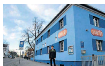
Neuer Mann oder Frau fürs Blaue Haus gesucht. CU