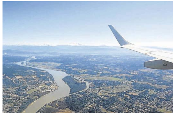
Überfüllte Hörsäle und Fernweh versus leere Kassen und Frust: Ein Stipendium kann helfen.

Die alte Weisheit „Reisen bildet“ wird auf dieser Seite ja regelmäßig bemüht – und gepflegt: Zum einen in Reiseerzählungen, die Appetit machen sollen auf Erfahrungen rund um den Globus, und zum anderen in Form von Tipps, wie man auf fundierter Basis ins Ausland kommt. Die erste Möglichkeit, die einem in den Sinn kommt, ist gleichzeitig die am weitesten verbreitete: ein Austausch. Doch oftmals mangelt es am nötigen Kleingeld. Die „Weltbürger“-Stipendien sind ein guter Weg für Jugendliche, gesponsert den Weg ins Ausland anzutreten. Deutsche Austausch-Organisationen und der unabhängige Bildungsberatungsdienst „Welt-