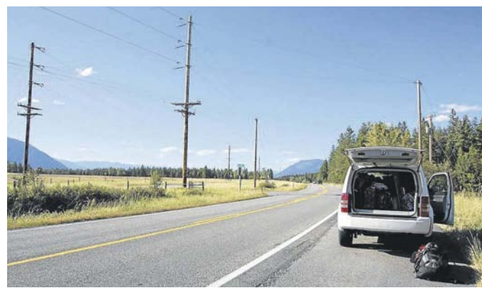
Am Horizont wartet Kanada.