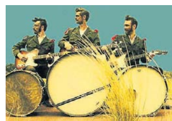
Diddy Sponge Bob Brothers.

schon Eindruck könnte man davon ausgehen, es in der Tat mit einer echten, staubigen mexikanischen Kapelle zu tun zu haben, die der traditionellen mexikanischen Musik alternative Seiten hinzuzufügen. Für Freunde von Tarantino-Soundtracks bestens geeignet. Christoph Ulrich Rookie Records / Cargo