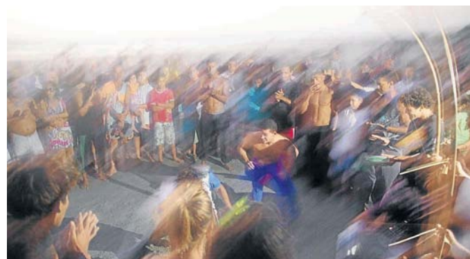
Leckeres Essen und Begegnung im Sport: Capoeira (unten) funktioniert nach einem Caipiruja (re.) nicht mehr so gut, setzt eiweißhaltige Krebse (li.) hervorragend in Muskeln um. PE5