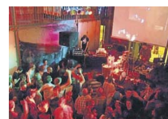
Peißenberg treibt's bunt. FKN