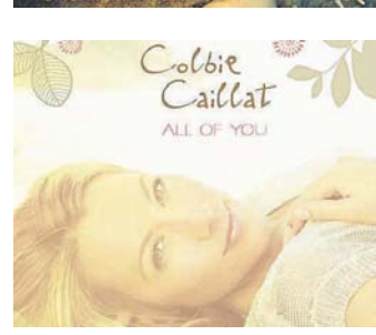
Trees, Corr, Caillat. FKN