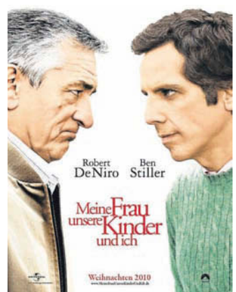
Nubes de Papel & Focker. FKN