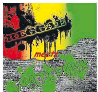
...meets Skatepunk. FKN