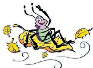
Maskottchen Manfred. FKN