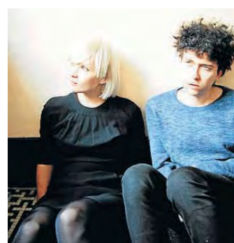
Duo-Zeit: Kills & Raveonettes.