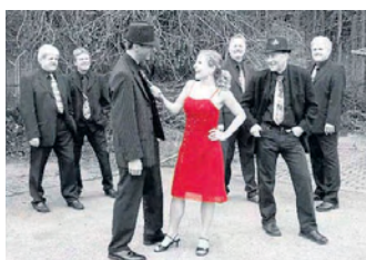
Live Time bei der Musiktage.